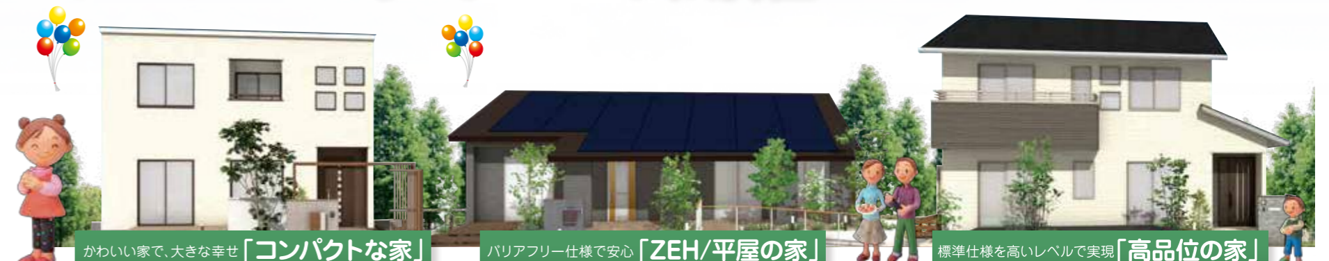
かわいい家で、大きな幸せ「コンパクトな家」

会場はこちら あいホーム 仙台若林住宅公園 〒984-0823 宮城県仙台市若林区遠見塚2丁目36-20 ☎0120-681-032