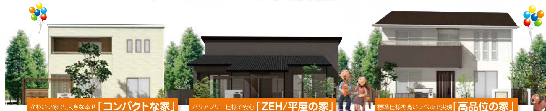
かわいい家で、大きな幸せ「コンパクトな家」

会場はこちら あいホーム 佐沼住宅公園 〒987-0511 宮城県登米市迫町佐沼字江合三丁目9-7 ☎0120-334-487